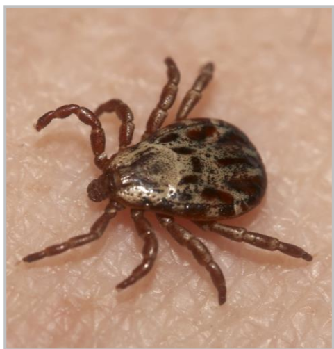
Луговой клещ рода Dermacentor

В северной подзоне области, на территории Александровского, Верхнекетского, Каргасокского районов и г. Стрежевого, где ежегодно происходит 200-300 случаев присасывания клещей, наблюдается спорадическая заболеваемость КИ (1-3 случая в год). В средней подзоне, в Бакчарском, Колпашевском, Кривошеинском, Молчановском, Парабельском, Первомайском, Тегульдетском и Чаинском районах, а также в г. Кедровый за год регистрируется от 2 500 до 3 000 случаев присасывания клещей и наблюдается низкий уровень заболеваемости КИ (2-6 случаев в год). В южной подзоне, в Асиновском, Кожевниковском, Томском и Шегарском районах риск заражения КИ наиболее высок. На долю этих районов приходится от 70 до 86 % случаев присасывания клещей и заражений инфекциями.