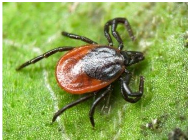
Таежный клещ рода Ixodes

На сегодняшний день клещевые инфекции стали проблемой крупных населенных пунктов. В Томской области это касается, прежде всего, территории г. Томска и его рекреационной зоны, где обитает два плохо отличимых друг от друга вида иксодовых клещей ( Ixodes ): таежный и клещ Павловского. В последние годы возросла численность ещё один клеща – лугового, принадлежащего к роду Dermacentor , который имеет два пика активности – весенний (май-июнь) и осенний (август-сентябрь). Ввиду экологических особенностей клещей и различий в их биологии случаи присасывания наблюдаются в несвойственных ранее местах – в парках, на придомовой территории, на спортивных и детских площадках и т.п.